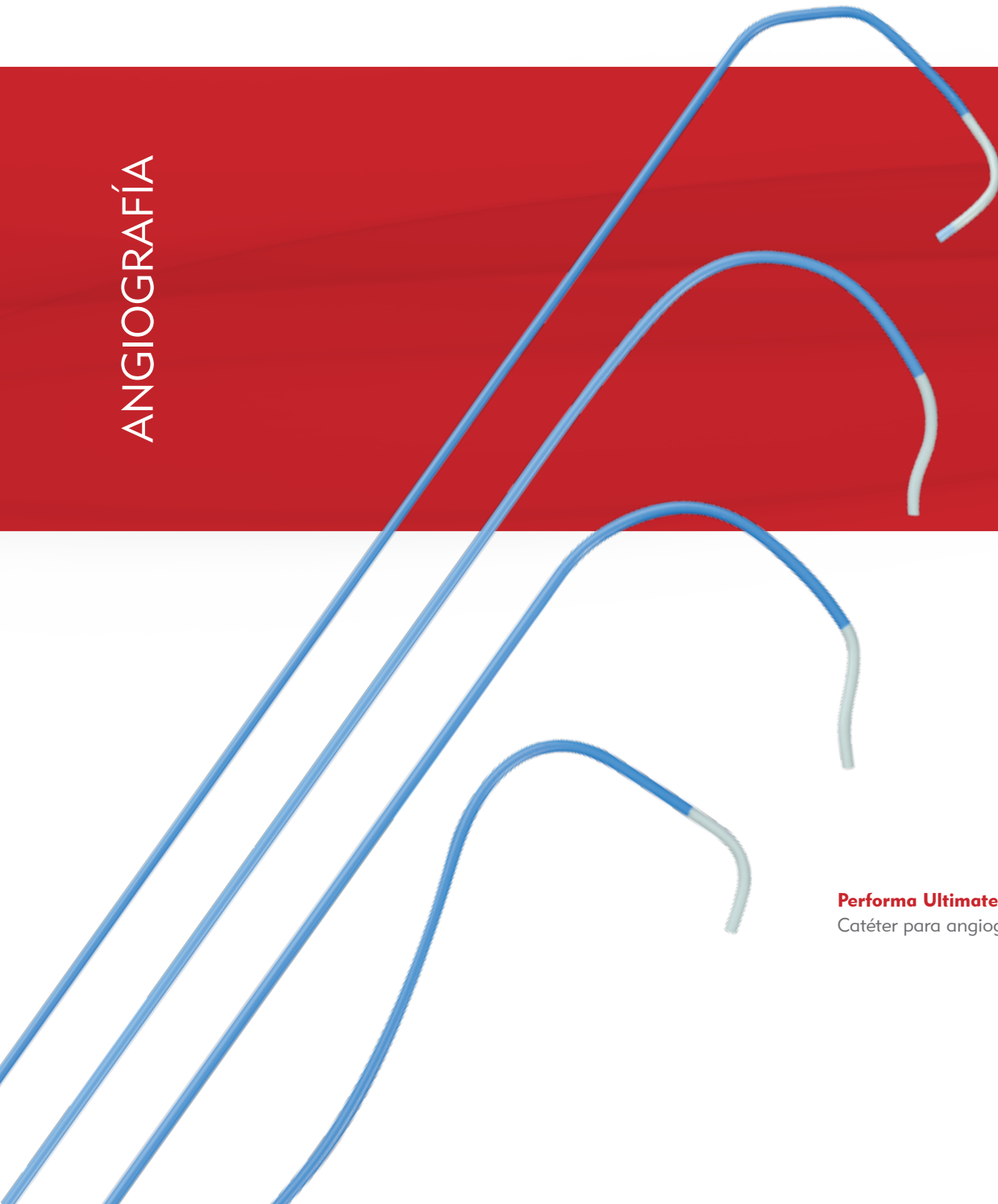
Performa Ultimate® Catéter para angiografía