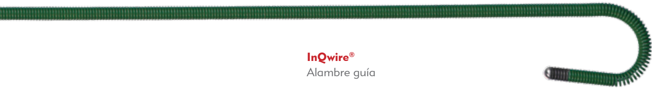
InQwire® Alambre guía