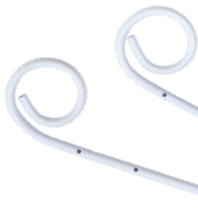
MIV® Catéter para ventriculografía por vía radial